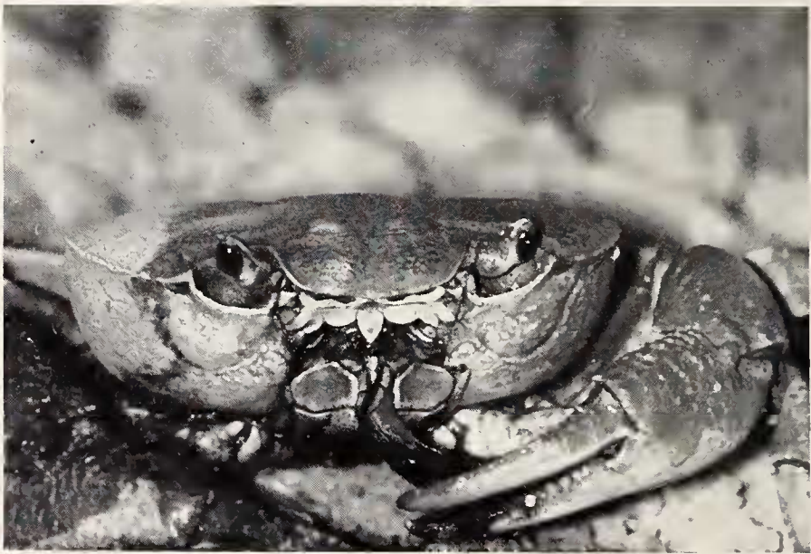
Abb. 3. Krabbe beim Fressen eines Fisches, der ganz mit dem Kopf nach vorne aufgenommen wurde, dabei schob die Schere den Fisch immer nach. Der Freißakt fand auf dem Trocknen statt.

Sind stehende Gewässer nicht eutrophiert, dann findet man immer wieder Krabben. Im Quarga-See zum Beispiel halten sich die Krabben bevorzugt an den gemauerten Uferbefestigungen auf, wo sie tagsüber auf dem Trockenen sitzen. Die flachen Sandstreifen werden gemieden. Im Stausee selbst wurden überwiegend erwachsene Tiere gefunden, während